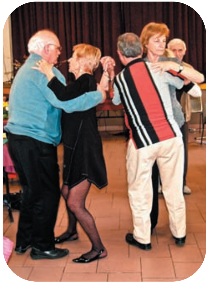
Quoi de mieux qu'une petite danse pour digérer ce fabuleux repas ...