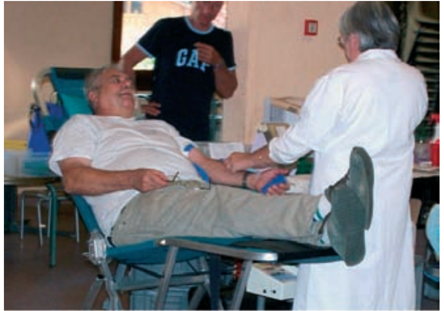
Prélèvement de notre ancien président