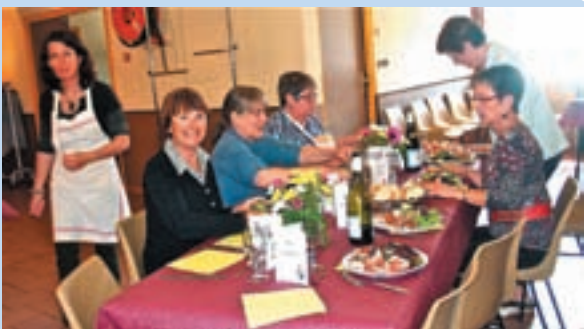
La préparation du repas a aiguisé notre appétit!