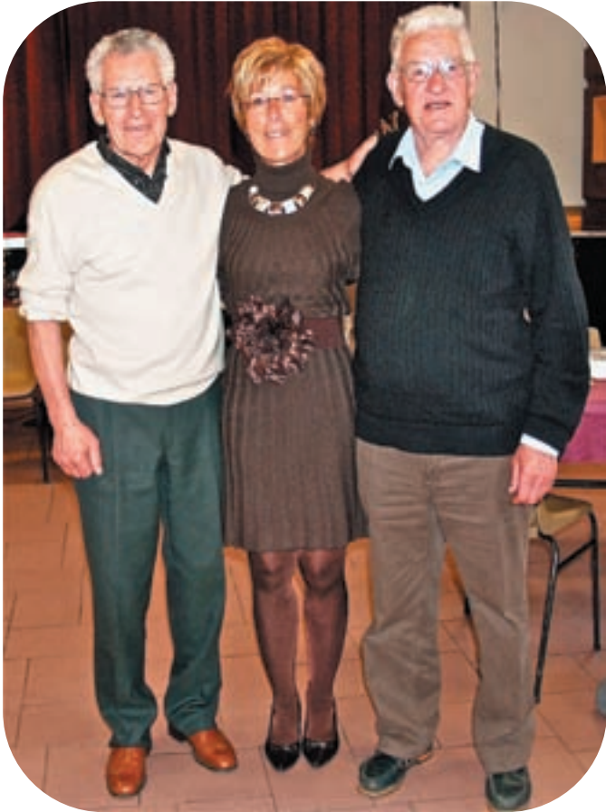
Trois "anciens" élus ... Encore la pêche !