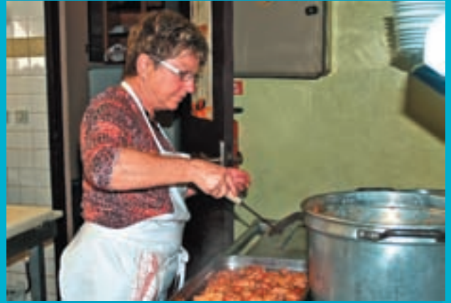
Colette ... accélère. Les invités arrivent !