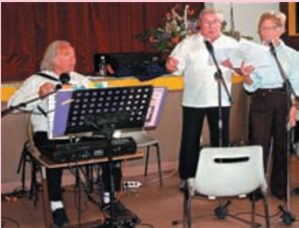
Les chants montagnards de notre jeunesse...Quel régal!