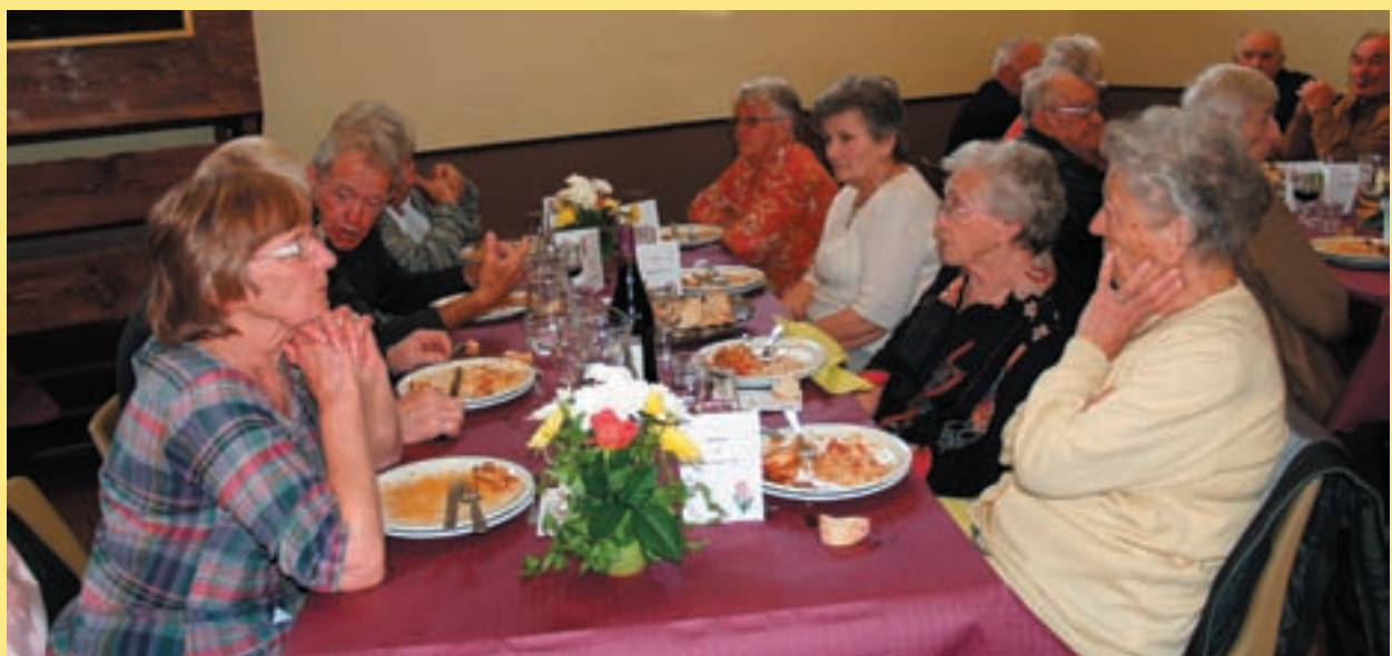
On attend...on attend ...le dessert... le dessert...